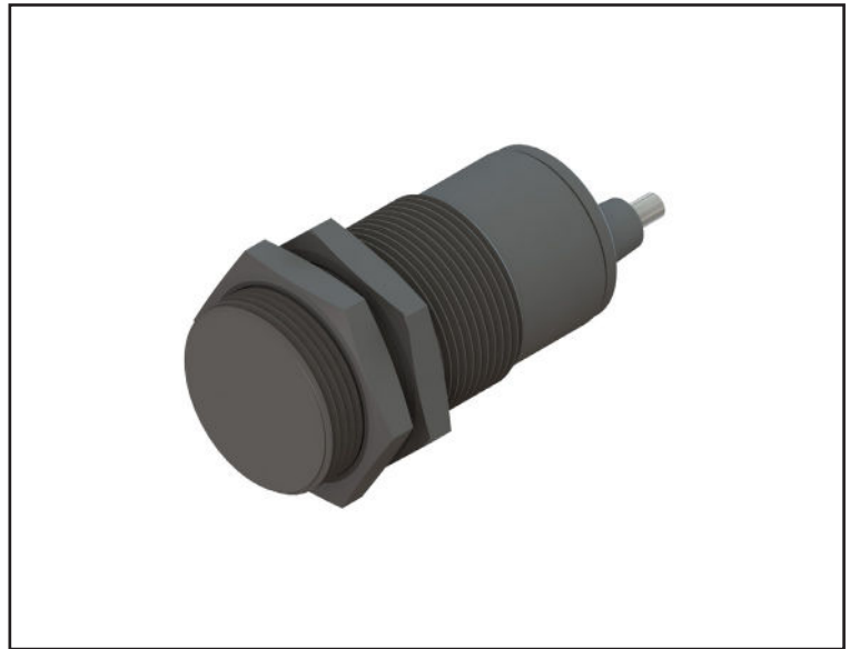
سیم بندی سنسور

Faranegar Inductive N.O DC Heavy Duty M30 Non-Flush Sn=15mm