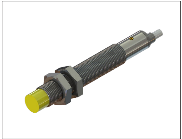
سیم بندی سنسور